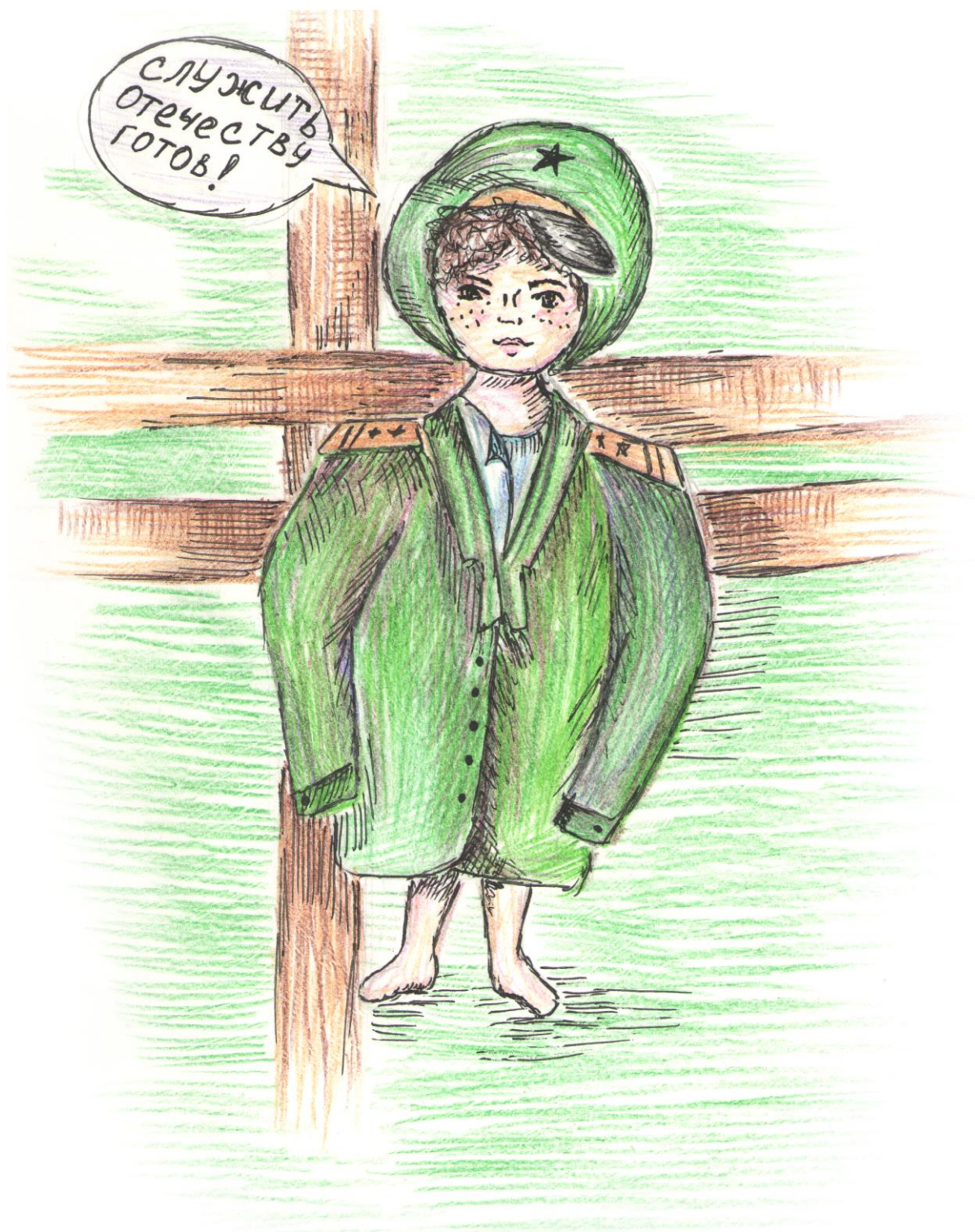
Рисунок Дарьи Селиверстовой, 14 лет, г. Новотроицк Оренбургской области