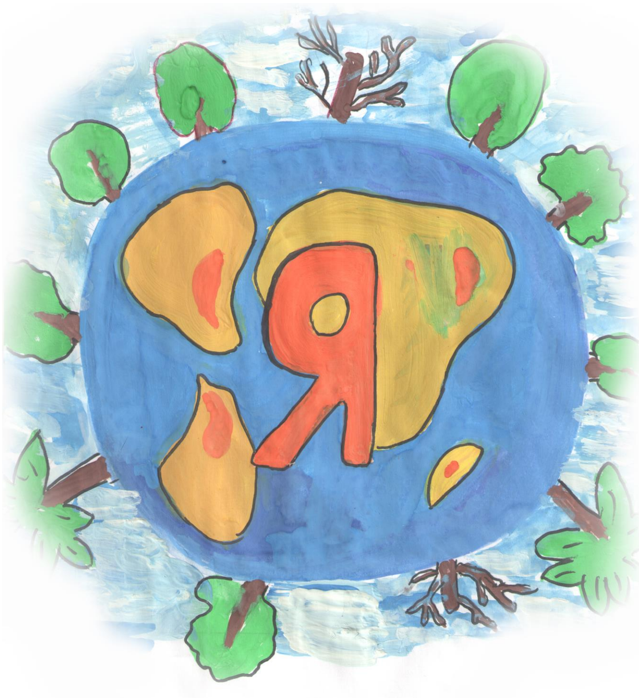
Рисунок Алёны Медведевой, 12 лет, г. Братск Иркутской области