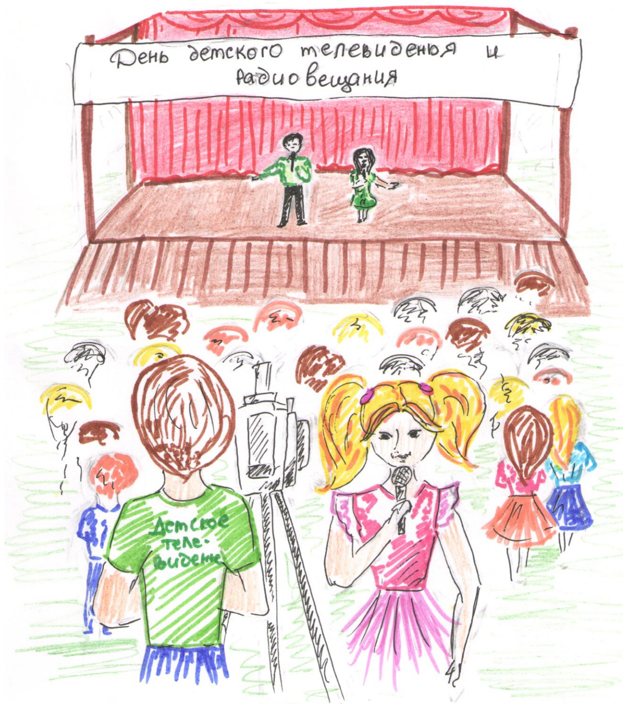
Рисунок Анны Козловой, 14 лет, г. Великий Новгород

ОСТАВАЙСЯ НА СВЯЗИ! Идеи дел для информационно-медийного направления РДШ